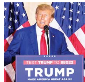
El ex presidente Donald Trump alentó a sus seguidores en el Congreso para tumbar a Kevin McCarthy como “Speaker”.

AGM: Para rematar, esta semana dantesca, algunos líderes radicales republicanos están haciendo circular el rumor o “bulo” que estarían dispuestos a proponer a su ídolo,