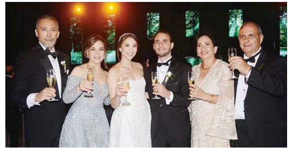
El tradicional brindis nupcial en honor a los esposos Anðonie-Dox.