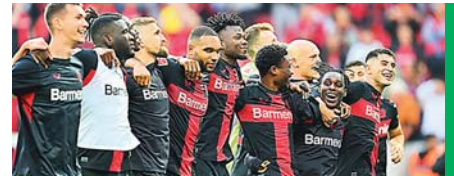
El Bayer Leverkusen aguantó otra jornada en la cima de la Bundesliga.

rusia Dortmund igualado a puntos con el Bayern.