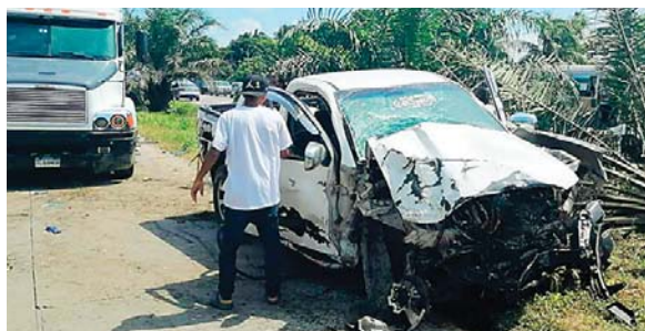
A la altura de Río Blanquito, de Choloma, al menos tres vehículos participaron en un fuerte choque.

Versiones indican que el pickup circulaba por la calle que conduce hacia Puerto Cortés, el conductor aseguró que el conductor de otro carro lo arrolló, lo que provocó que saltara la mediana y cayera a la trocha que va para San Pedro Sula, donde impactó con la camioneta gris, la cual dio varias vueltas, para poste-