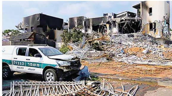
Una comisaría de policía destruida e invadida por Hamas.

Criticó que los atacantes no tienen misericordia, ni criterio