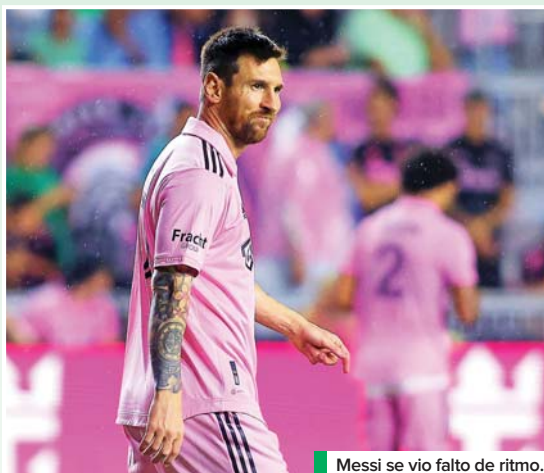
Messi se vio falto de ritmo.

Aunque le quedan dos partidos por jugar, el equipo que dirige Gerardo Martino se encuentra a siete puntos de la novena plaza, la última que da acceso a playoffs.