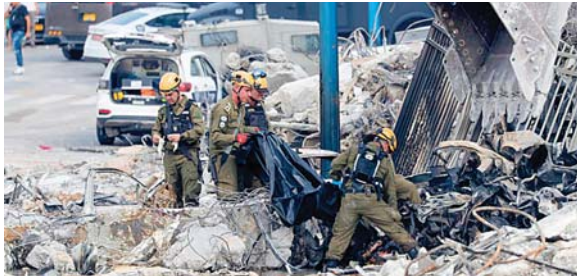
Israel tiene "derecho a defenderse" de los ataques "bárbaros" de Hamás, dijeron autoridades.

El Ejército israelí informó, además, de que sus tropas se siguen enfrentando con milicianos palestinos que se infiltraron a distintas comunidades.