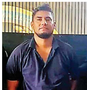
Al sospechoso también se le investiga por otros asesinatos.

A esta persona se le decomisó un arma de fuego con su respectivo cargador y varios proyectiles.