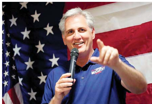
Kevin McCarthy, el depuesto presidente (“Speaker”) de la Cámara de Representantes por un reducido grupo de congresistas republicanos “trumpistas” y todos los demócratas del Congreso.

JG: Gaetz es un tipo desdeniable que ha causado lío tras lío, toda una serie de controversias y disputas en la Cámara Baja. Fue el que llevó a McCarthy para ser presidente de la Cámara Baja y después fue el diputado clave para elegirlo. Y fue el hombre instrumental para sacarlo