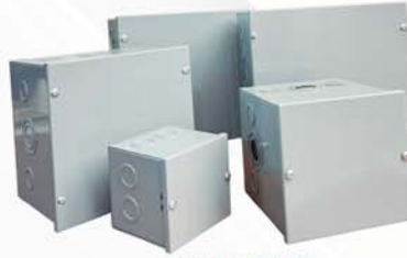
CAJAS DE REGISTRO