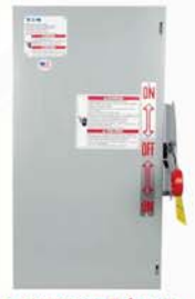
TRANSFERENCIA ELÉCTRICA MANUAL