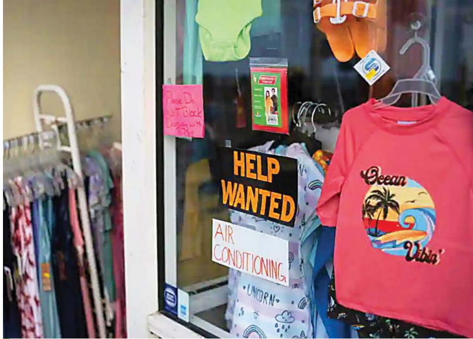
Un cartel de “Se busca” ayuda en el escaparate de una tienda en Ocean City, Nueva Jersey, el 18 de agosto de 2023.

El crecimiento del empleo se había estado desvaneciendo en los últimos meses, según datos