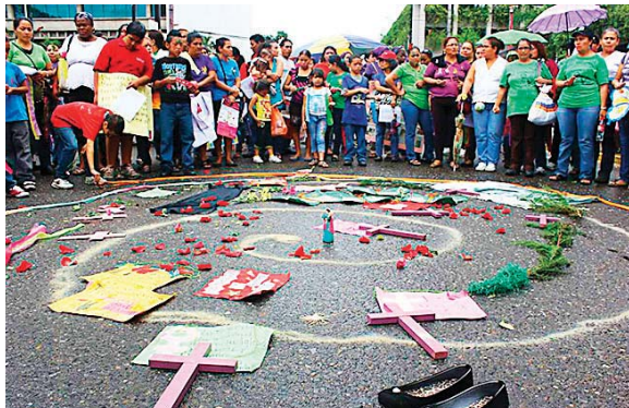
El Conadeh dijo que es indispensable hacerle frente a una serie de desafíos como la violencia de género.

Sumado a eso, el índice de participación política femenino está por debajo del 40 %, que se mantiene retrasado en relación con la parti-