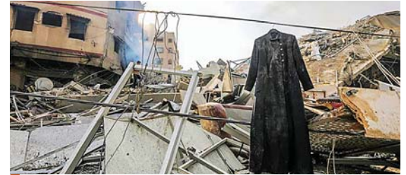
En Gaza, la cifra de heridos alcanzó ayer los 2,000 tras una nueva serie de bombardeos israelíes.

Las alarmas antiaéreas prácticamente no han dejado de sonar en la zona debido al lanzamiento de cohetes desde Gaza, desde donde las milicias han lanzado 3,255 proyectiles desde el comienzo de su ofensiva en la mañana del sábado, según las últimas cifras difundidas por el Ejército.