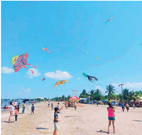
El festival del papelote fue una fiesta playera para los niños.

En el sector de las playas municipales de El Porvenir se llevó a cabo un evento que pintó de colores las playas el pasado viernes,