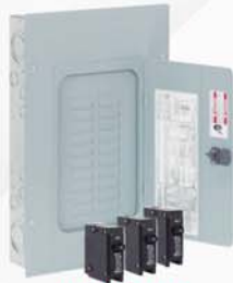
CENTRO DE CARGA