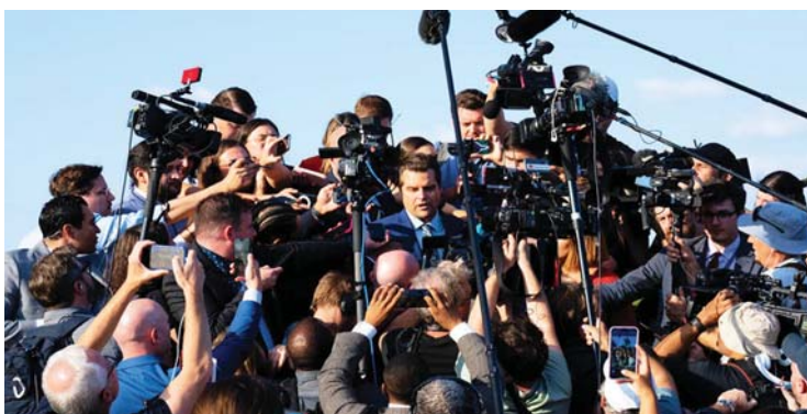
El congresista republicano “trumpista” Matt Gaetz, el instigador del golpe contra Kevin McCarthy.