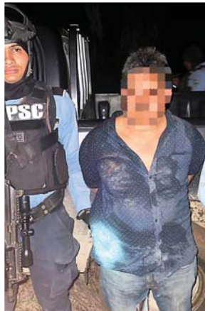
Las dos primeras detenciones se realizaron el miércoles pasado en Colón.

El pasado miércoles, el ministro de Seguridad, Gustavo Sánchez, in-