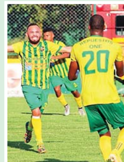
Parrillas revivió las opciones de clasificar a la liguilla goleando a Platense.