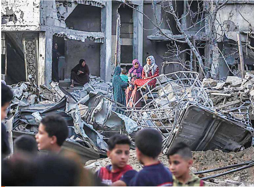
Guterres dijo que “los civiles deben ser respetados y protegidos en todo momento”.