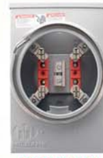
BASE DE MEDIDOR