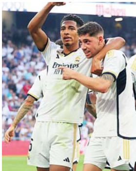
En otro recital de Jude Bellingham, el Real Madrid goleó el sábado al Osasuna.

Un día antes, el Real Madrid goleó 4-0 al Osasuna en otro juego liderado por Jude Bellingham, autor de un doblete. Diez goles