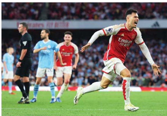
Martinelli y la afición celebrando, con todo, la victoria.

En esta ocasión, se repusieron al gol de Simon Adingra (20') con un tanto de Salah (40') y un penal convertido por el atacante egipcio (45'+1') antes del descanso. El capitán de los Seagulls Lewis Dunk (78') fue el autor del empate final.