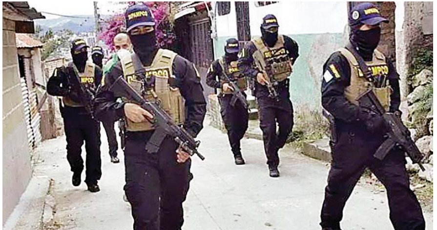
El estado de excepción ha permitido la captura de «más de 5,000 personas de estructuras criminales vinculadas a maras y pandillas», según las autoridades de Seguridad.

El país también ha registrado en 2023 una reducción en la tasa de homicidios, recordó el portavoz de la Secretaría de Seguridad.