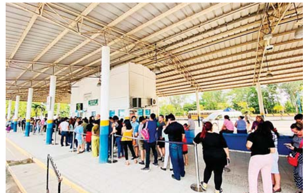
Muchos hondureños cruzaron la frontera con Guatemala para vacacionar en aquel país.