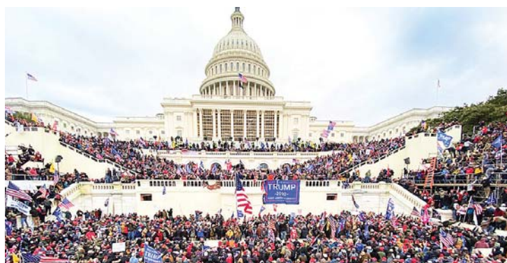
El asalto al Congreso norteamericano del 6 de enero de 2021 por los seguidores del entonces presidente, Donald Trump. (Foto Tayfun Coskun- Anadolu Agency).