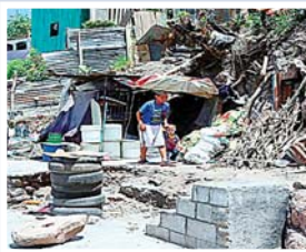
El líder católico pide al Estado que se interese en ayudar a los más necesitados.

Indicó que “necesitamos que el Gobierno también dé pasos para ayudar, realmente, cuando con-