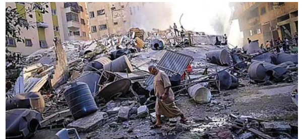
La Cancillería hondureña enfatizó que los ataques indiscriminados y las provocaciones solo contribuyen a alimentar la espiral de violencia.

También lamentó que, en 2023, coincidiendo con el 30 aniversario de los Acuerdos de Paz de Oslo, “se observe un deterioro grave y creciente de la situación de seguridad entre Israel y Palestina”.