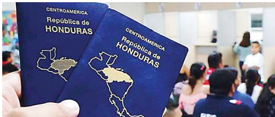
Honduras podría pedir visa a los costarricenses que visiten el país.

sábado que respeta la decisión de Costa Rica de solicitar visa a los hondureños, pero confía en que la medida sea temporal.