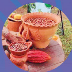
Tour Sensorial de Cacao