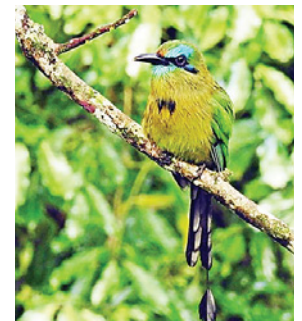
Para los amantes del aviturismo el Lago de Yojoa es el lugar ideal.