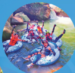
Turismo de Aventura