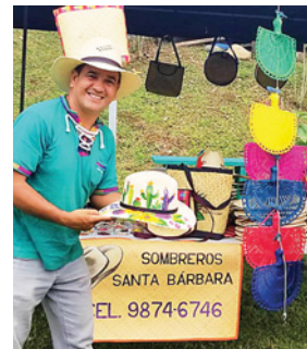
Apoya a nuestros emprendedores en los Bazares.