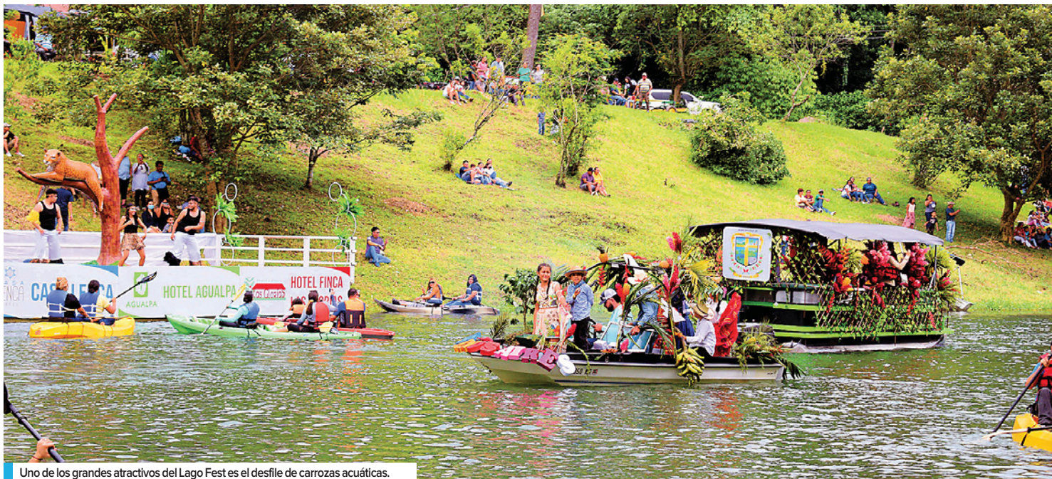
Uno de los grandes atractivos del Lago Fest es el desfile de carrozas acuáticas.