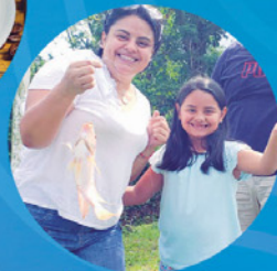
Aprendiendo a pescar