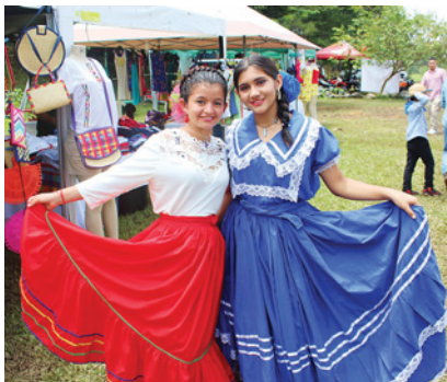
La cultura es parte de las actividades de Lago Fest.

-6:00 P.M. Fuegos artificiales en Brisas del Canal y Buenos Aires.