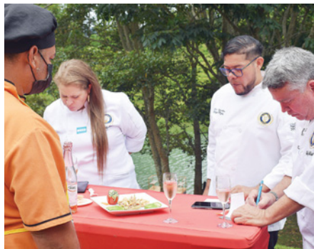
El Lago Chef será el sábado 3 de junio en Brisas del Canal.