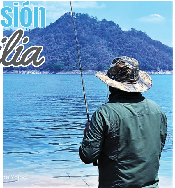
Si te gusta la pesca, puedes participar en el torneo.

-11:00 A.M. Lago Chef Especias Don Julio en Brisas del Canal - El