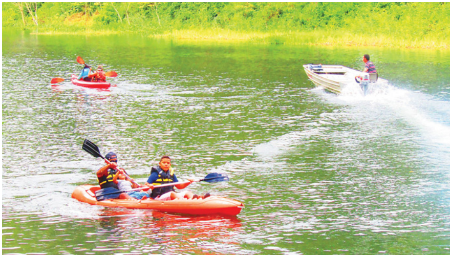
El paseo en kayak en el Lago de Yojoa es la actividad preferida por los visitantes.

Aventura, naturaleza, gastronomía, competencias, bazares, es un abanico muy amplio de actividades que Canaturh Lago de Yojoa ha preparado para la diversión de toda la familia en la quinta edición de Lago Fest.