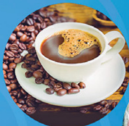
Tour Sensorial de Café