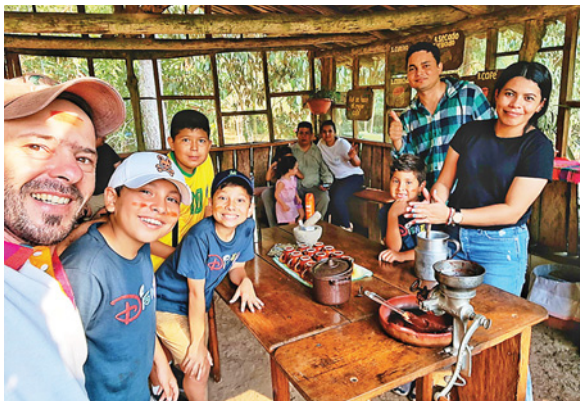
Despiertas tus sentidos con el tour sensorial de café y cacao.

Una de las grandes innovaciones de este año es Lago Trail, una competencia que constará de dos modalidades, 5 y 10 kilómetros en categorías de 19 a 29 años, de 30 a 39, de 40 a 49 y mayores de 50, en masculino y femenino.